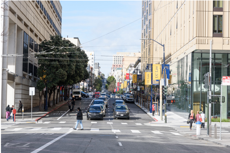
Hyde Street example with Road Diet and Bus/Taxi Only lane

Các con phố ở Tenderloin hoàn toàn nằm trong Mạng lưới Thương tích Cao (High Injury Network) của San Francisco, tức là 12% số đường phố nơi xảy ra 68% vụ va chạm gây thương tích trong 5 năm qua. Dự án Xây dựng Nhanh Larkin (Larkin Quick-Build) dựa trên và mở rộng thêm những cải thiện về an toàn cho người đi bộ đã được triển khai trong khắp khu dân cư. Dự án này sẽ bao gồm một đoạn thu nhỏ đường giữa Market Street và Sutter Street, nâng cao độ tin cậy của phương tiện giao thông công cộng và xem xét lại việc quản lý lề đường. Dự án cũng sẽ phối hợp với dự án trải nhựa mùa xuân năm 2025 và Dự án Nâng cấp Tín hiệu Giao thông Tenderloin.