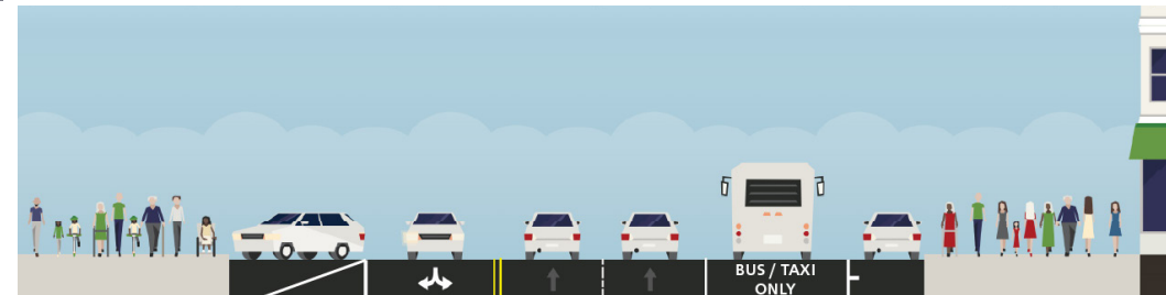
Proposed Road Diet and Transit Only Lane - Larkin, between Grove and Fulton streets