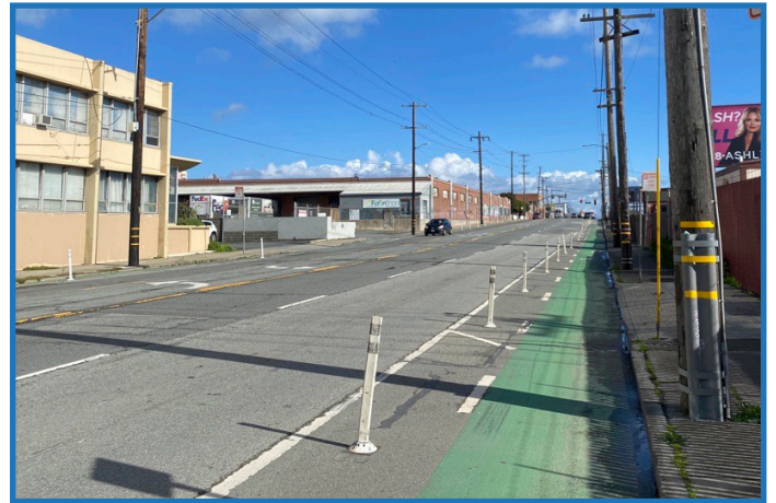
Cesar Chavez街在Evans Avenue附近今貌

專案界限：堪薩斯街 (Kansas St) 至賓夕法尼亞大道 (Pennsylvania Ave)