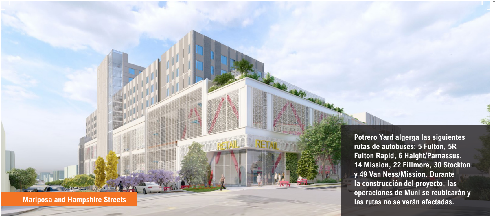
Mariposa and Hampshire Streets

Potrero Yard alberga las siguientes rutas de autobuses: 5 Fulton, 5R Fulton Rapid, 6 Haight/Parnassus, 14 Mission, 22 Fillmore, 30 Stockton y 49 Van Ness/Mission. Durante la construcción del proyecto, las operaciones de Muni se reubicarán y las rutas no se verán afectadas.