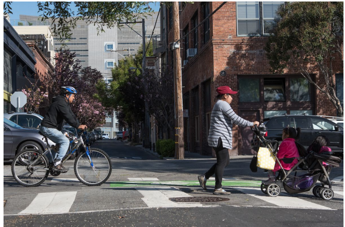
Folsom sa Sherman street

Matatagpuan sa kapitbahayan ng South of Market (SoMa), sa pagitan ng 11th Street at 2nd Street, pagbubutihin ng Folsom Streetscape Project ang kaligtasan sa koridor kung saan madalas magkapinsala, babawasan ang mga paglabas ng greenhouse gas, susuportahan ang nagpapabagong pananaw ng Lungsod para sa SoMa bilang hub sa rehiyon, at pagbubutihin ang pagbiyahe ng mga bisita at residente, kabilang ang mga populasyong may mababang kita na karamihang dumedepende sa pagsakay sa pampublikong transportasyon, naglalakad at nagbibisikleta. Sakop ng lugar ng Proyekto ang kalahati ng Folsom at Howard Street couplet kung saan siniserbisyuhan ng Folsom Street ang trapikong eastbound at siniserbisyuhan ng Howard Street ang trapikong westbound. Ang 12 Folsom Muni line ay bumibiyahe sa Folsom Street mula 11th Street hanggang 2nd Street at ang 27 Bryant Muni line ay bumibiyahe sa hanay ng Folsom Street sa pagitan ng 6th Street at 5th Street.