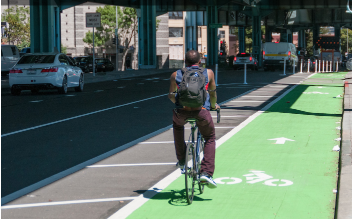
設置受保護的自行車道將自行車騎士和駕車者分隔開來