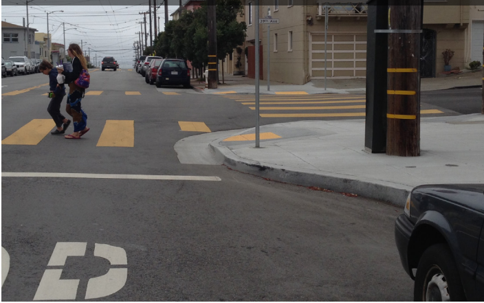
拓寬人行道以提高十字路口處行人的能見度並縮短過馬路時的穿行距離