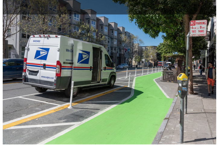
改造停車和裝載區以便充分利用路邊空間