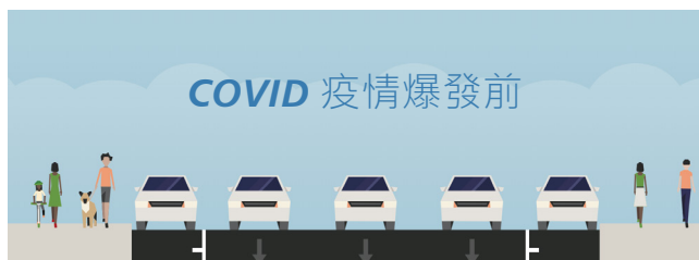
JONES STREET 街道橫斷面