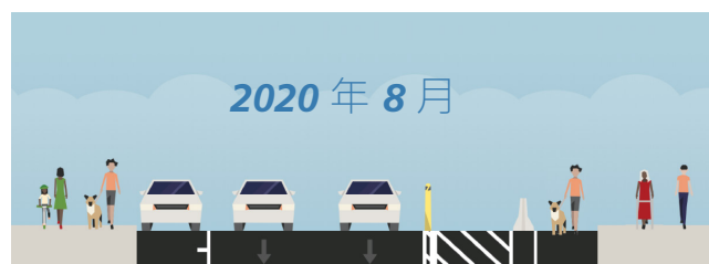
JONES STREET 街道橫斷面

Jones Street 快速建設專案將在 COVID-19 應變處理工作的基礎上，提出可調整的可逆交通安全改進方案，優先考慮最弱勢道路使用者的安全。