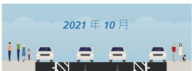
JONES STREET 街道橫斷面

Jones Street 快速建設專案將在 COVID-19 應變處理工作的基礎上，提出可調整的可逆交通安全改進方案，優先考慮最弱勢道路使用者的安全。