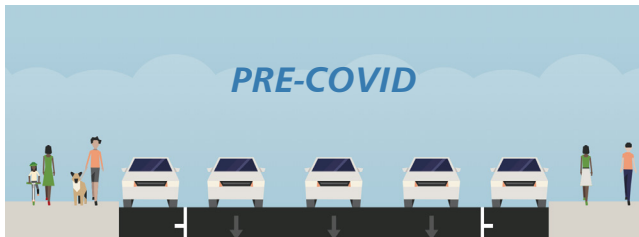
SECCIONES DE JONES STREET