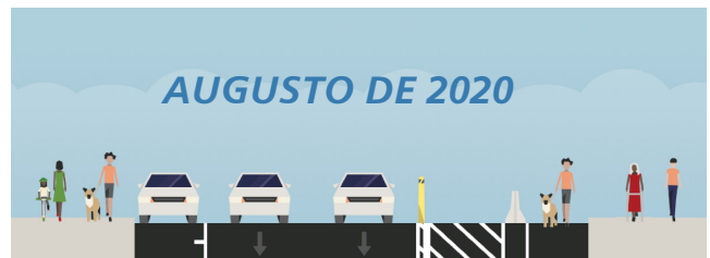
SECCIONES DE JONES STREET