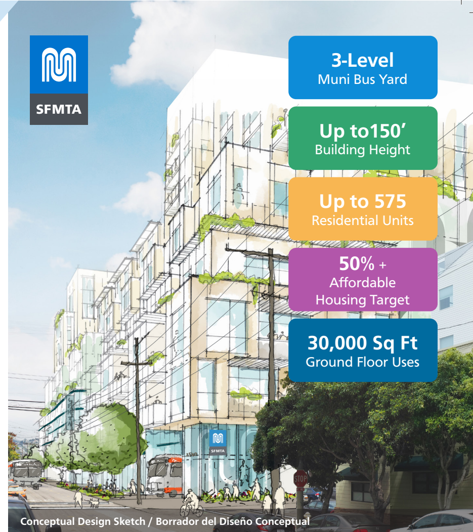
Conceptual Design Sketch / Borrador del Diseño Conceptual

Join an upcoming virtual meeting on Dec. 5 or Dec. 12. Details inside. Participe de una reunión virtual el 5 de diciembre o el 12 de diciembre. Ver los detalles adentro.