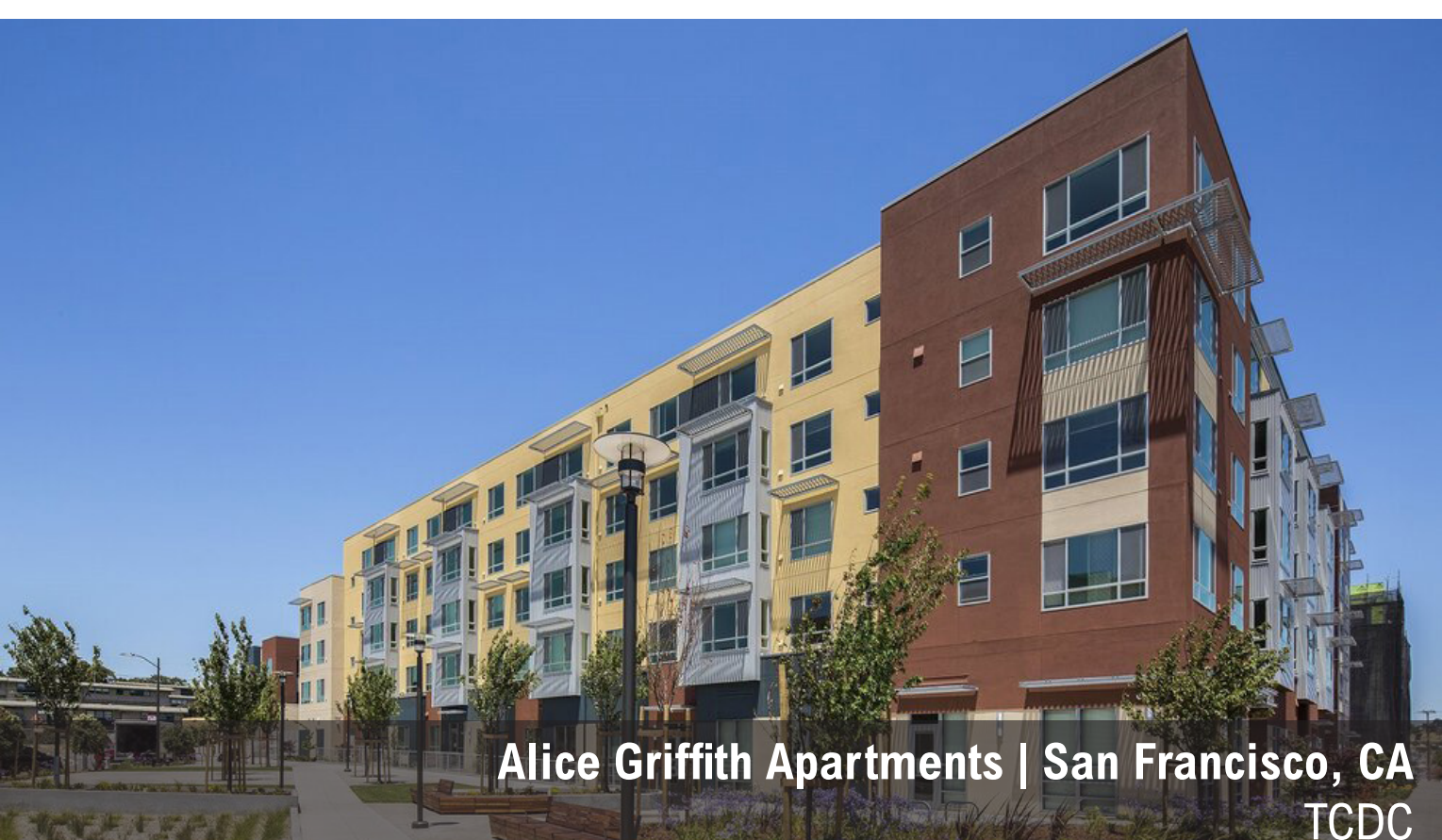
Alice Griffith Apartments | San Francisco, CA TCDC