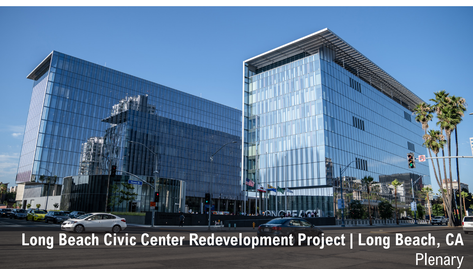
Long Beach Civic Center Redevelopment Project | Long Beach, CA Plenary

Consultant team with experience supporting infrastructure projects throughout San Francisco and the Bay Area. | Equipo de asesores con experiencia apoyando proyectos de infraestructura en todo San Francisco y el Área de la Bahía.