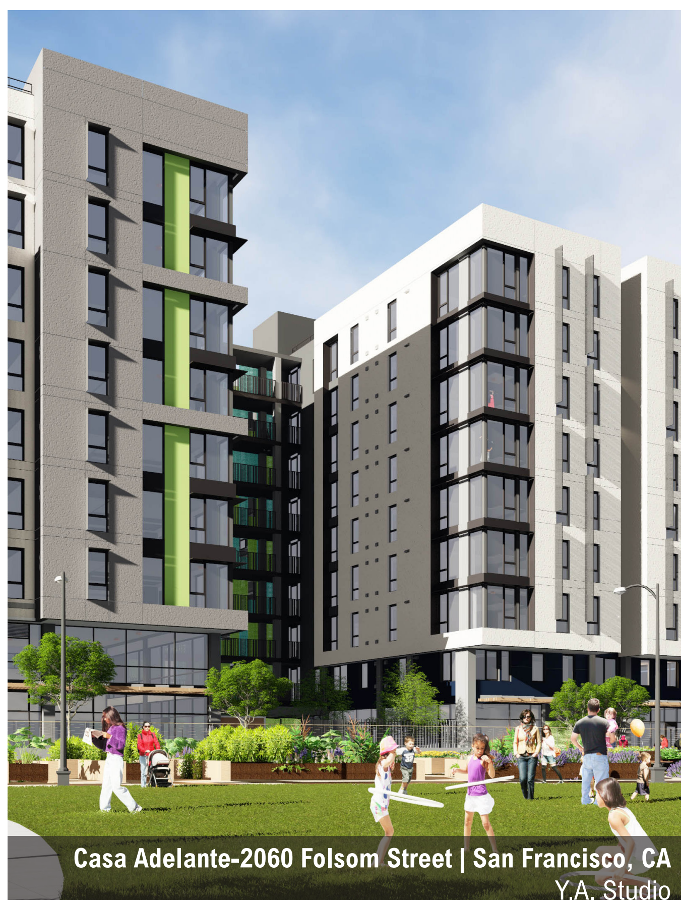
Casa Adelante-2060 Folsom Street | San Francisco, CA Y.A. Studio