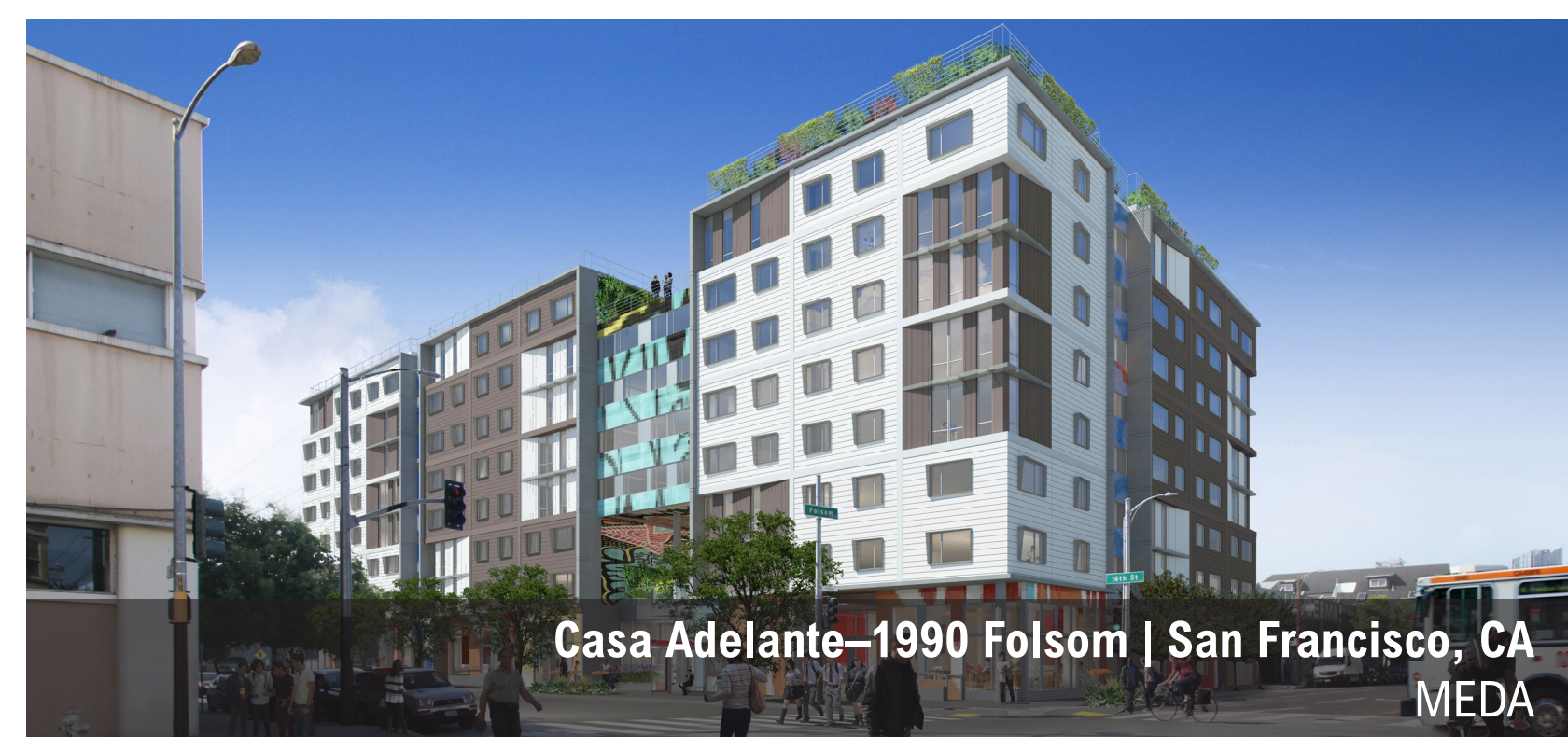
Casa Adelante-1990 Folsom | San Francisco, CA MEDA