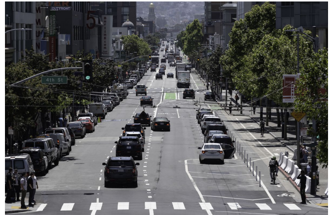
Esquina de las calles Howard y 4th, con vista al Oeste.

Luego de la aprobación del proyecto, SFMTA implementó varios trabajos de construcción rápida para mejorar la seguridad en la calle Howard, incluyendo una ciclovía protegida del carril de estacionamiento, con el propósito de hacer realidad algunos de los beneficios críticos de seguridad de este proyecto tan pronto como sea posible. Estos cambios proporcionan un beneficio inmediato y sirven como “cuota inicial” en la ejecución de la visión completa de la comunidad para la calle Howard a través del proyecto Howard Streetscape.