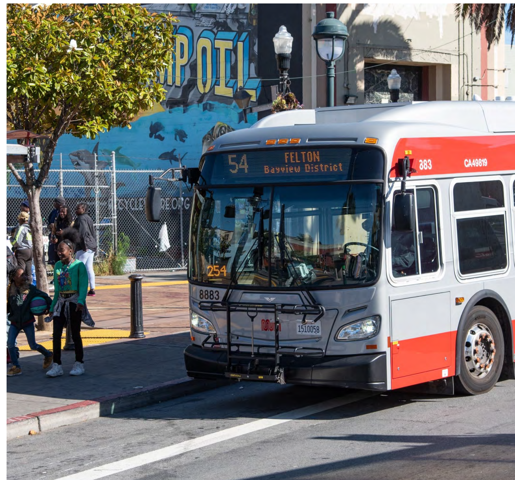
54 Felton at 3rd Street