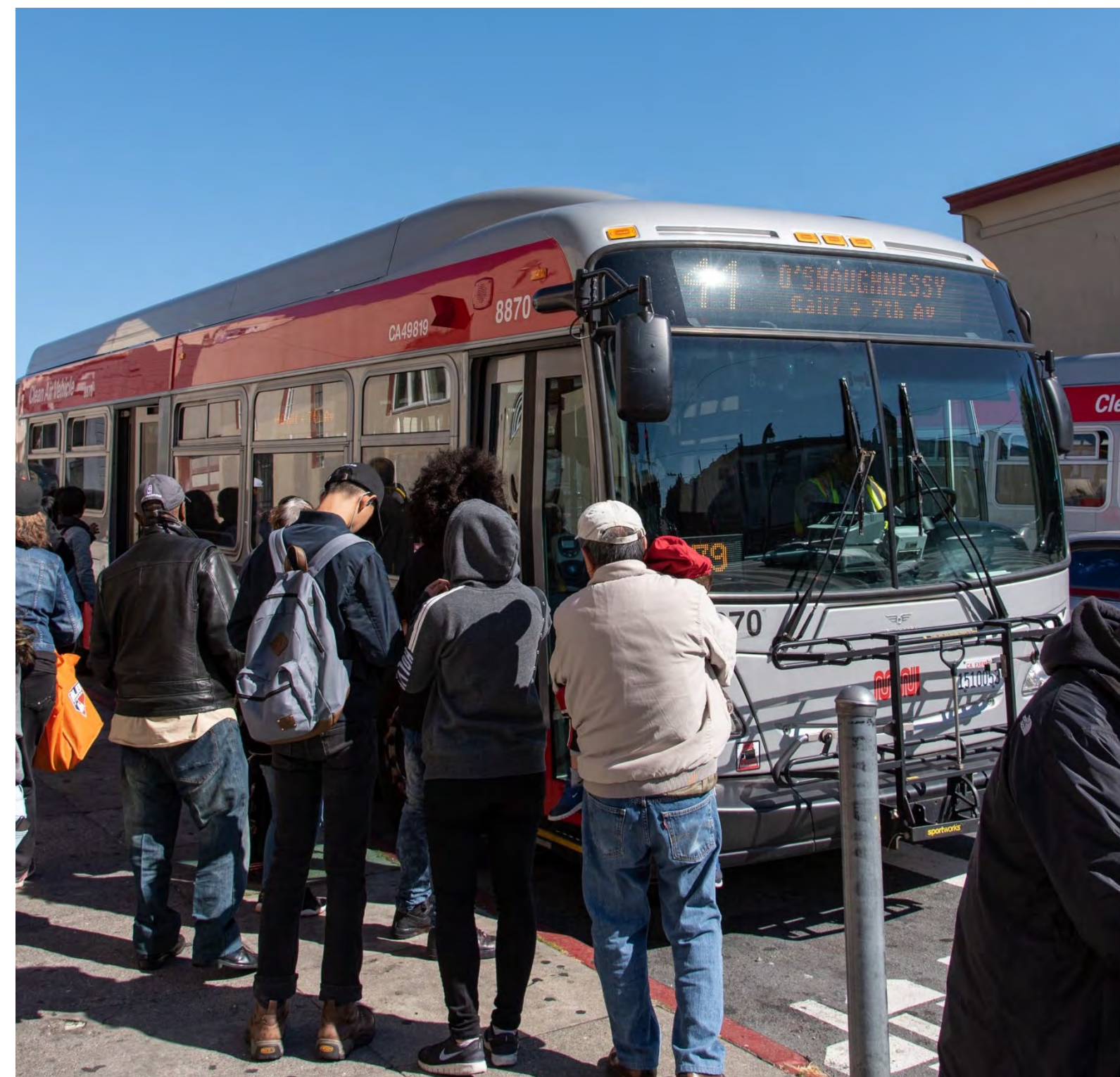
43 Masonic on Lombard Street