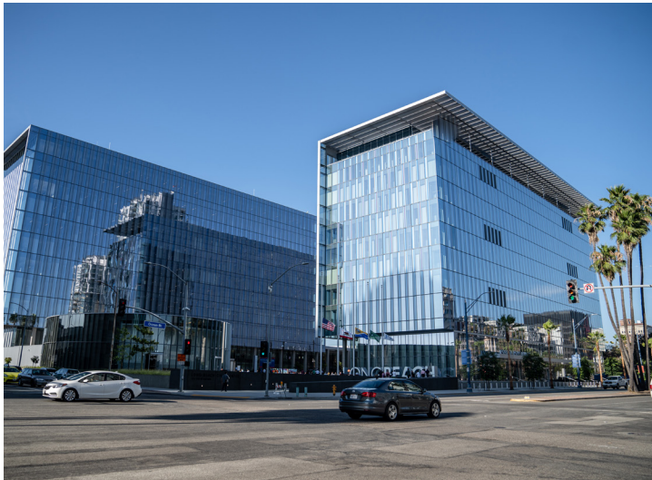
Foto: Long Beach Civic Center, Proyecto P3

Un P3 es un acuerdo contractual entre organizaciones del sector público y privado para diseñar, construir, financiar y mantener infraestructura pública. Como es típico en estos acuerdos, PNC invertiría su propio capital y recaudaría cualquier financiamiento adicional necesario para diseñar y desarrollar el Potrero Yard.