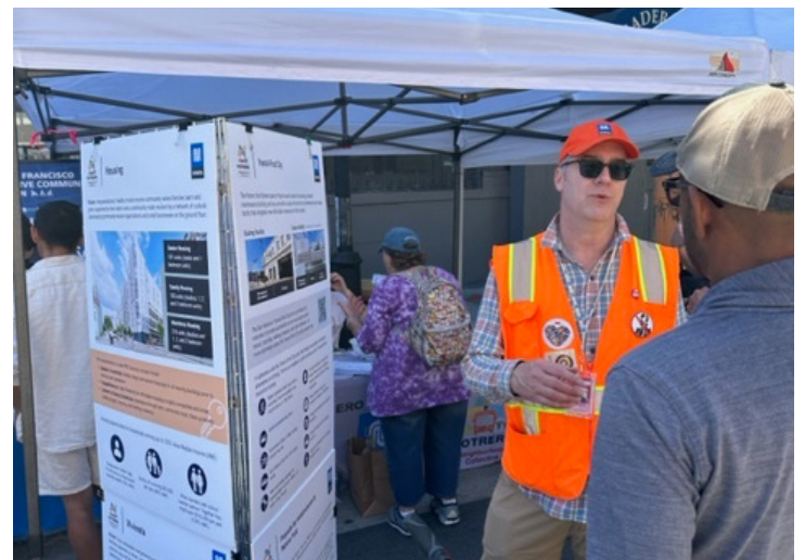
Foto: Evento de alcance comunitario, 2023