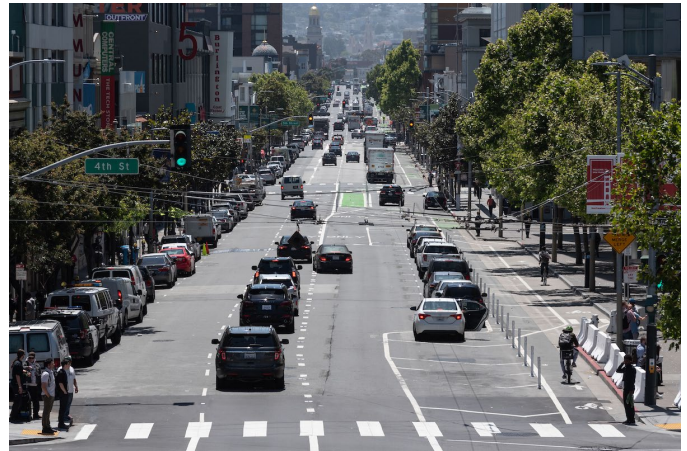
Howard Street sa 4th Street, tinatanaw westward

Sa Central SoMa Plan ng San Francisco noong 2018 inaprubahan ang karagdagang 16 milyong talampakang kuwadrado ng espasyo para sa bagong pabahay at trabahong nakatuon sa transit sa susunod na 25 taon. Ang Howard Streetscape Project ay ang pangunahing bahagi ng Plan at lubos na pagagandahin ang disenyo ng kalye upang mapaglingkuran nang mas mabuti ang mga kasalukuyang residente habang nagbibigay-daan din sa naipalang paglago.