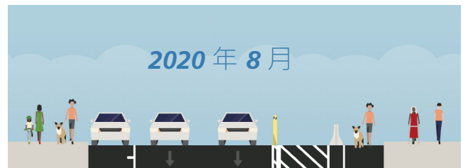
JONES STREET 街道橫斷面

Jones Street 快速建設專案將在 COVID-19 應變處理工作的基礎上，提出可調整的可逆交通安全改進方案，優先考慮最弱勢道路使用者的安全。