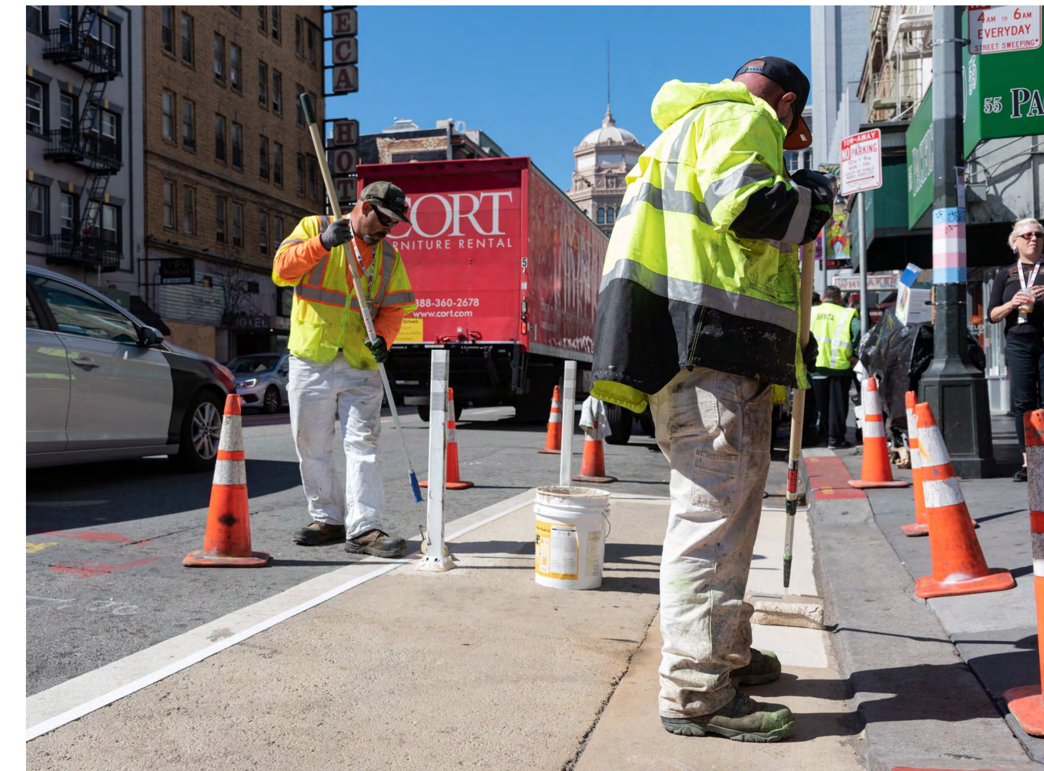
Быстровозводимый объект на 6-ой Street в рамках программы «Нулевая Концепция»