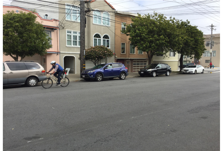
Anza Street, though not a designated bicycle route, is popular with cyclists