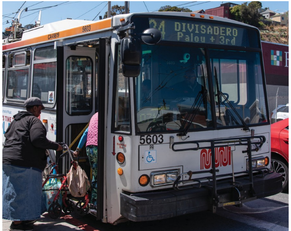
東南部Muni的擴展將包括對Candlestick Point-Hunters Point Shipyard捷運服務方案的修訂，以確保它能滿足舊金山東南部所有身軀的需求。

為了提供一項相關聯的願景，東南部Muni擴展團隊還將與Bayview社區交通方案和舊金山市縣交通策劃局的第10區流動研究項目進行合作。預計第一階段的東南部Muni的擴展將於2021年開始實施。