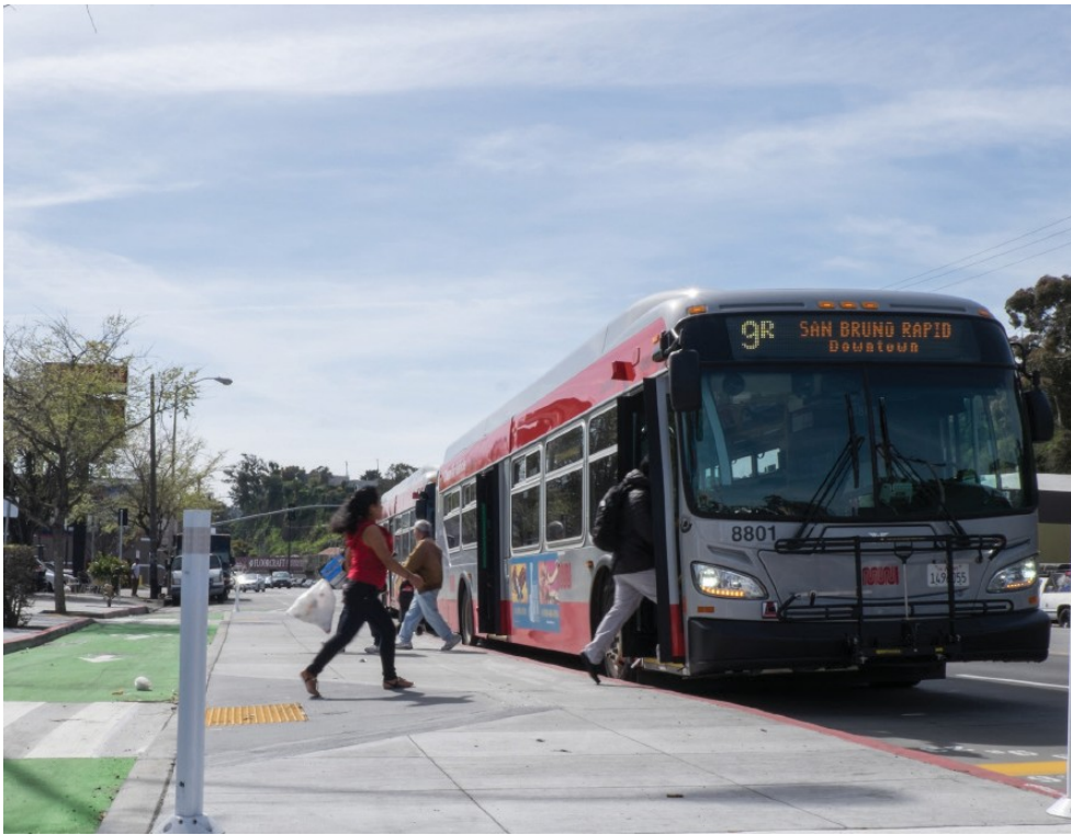
東南部Muni的擴展包括新的Muni公交車路線，路線延伸和路線變更，以及在Bayview-Hunters Point和Visitacion Valley的現有的Muni公交車路線上提供更頻繁的運行服務。