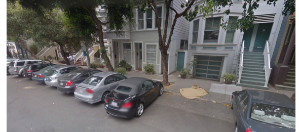
Добавочная парковка на боковых улицах