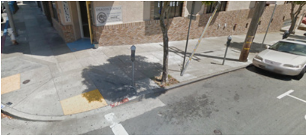
Замена парковки на авеню

некоторых районах, на перекрестках авеню идущих с севера на юг, пересекающих ул. Taraval, несколько параллельных парковочных мест будут преобразованы в парковку под углом в 45 градусов. Все подробности на сайте www.muniforward.com/L . Мы также планируем создать дополнительную, ориентированную на клиентов, краткосрочную парковку, расположенную ближе к торговым точкам, чтобы восполнить все утраченные парковочные места с ограниченным периодом парковки или со парковочными счетчиками по ул. Таравал. Для этого