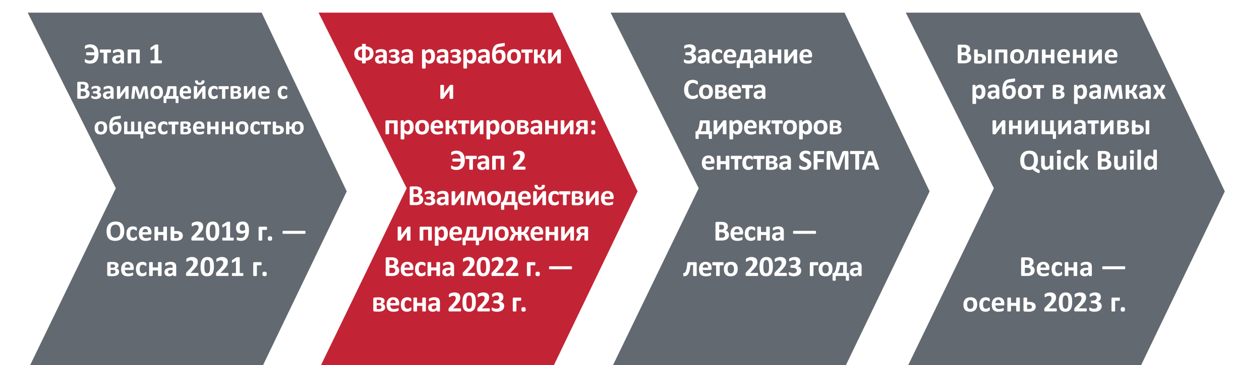
График проекта (могут вноситься изменения)