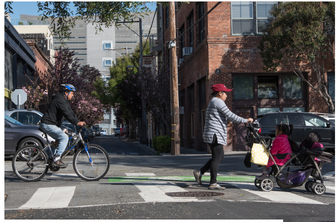
位於 Sherman 街的 Folsom

這項工程也解決三藩市「零死亡願景高事故傷亡交通網」(即三藩市75%的嚴重和致命交通事故發生在 13% 的街道上)的一條交通幹道, 即 Folsom 街 上嚴重的安全問題。2014 年至 2019 年期間, 這條