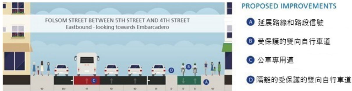
Folsom 街scape 街景改善工程的典型橫截面