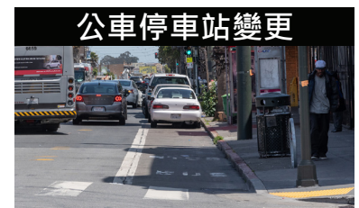
典型現有街道設置 (朝西看)