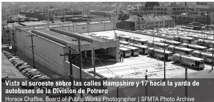
Vista al suroeste sobre las calles Hampshire y 17 hacia la yarda de autobuses de la División de Potrero