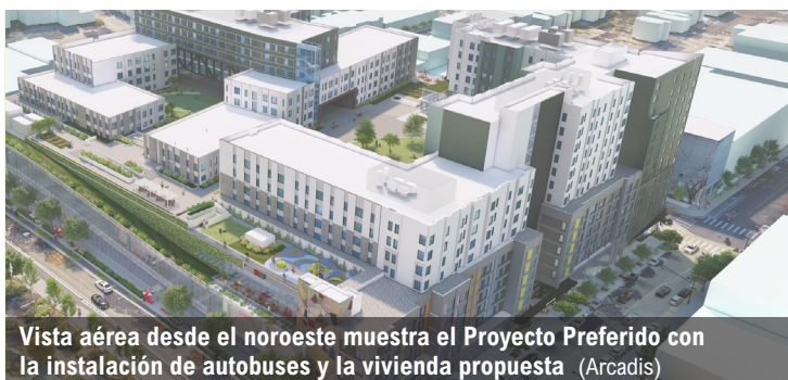
Vista aérea desde el noroeste muestra el Proyecto Preferido con la instalación de autobuses y la vivienda propuesta (Arcadis)

El Proyecto Preferido propuesto incluye: