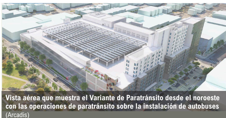
Vista aérea que muestra el Variante de Paratrásito desde el noroeste con las operaciones de paratrásito sobre la instalación de autobuses (Arcadis)

La Variante de Proyecto propuesta incluye: