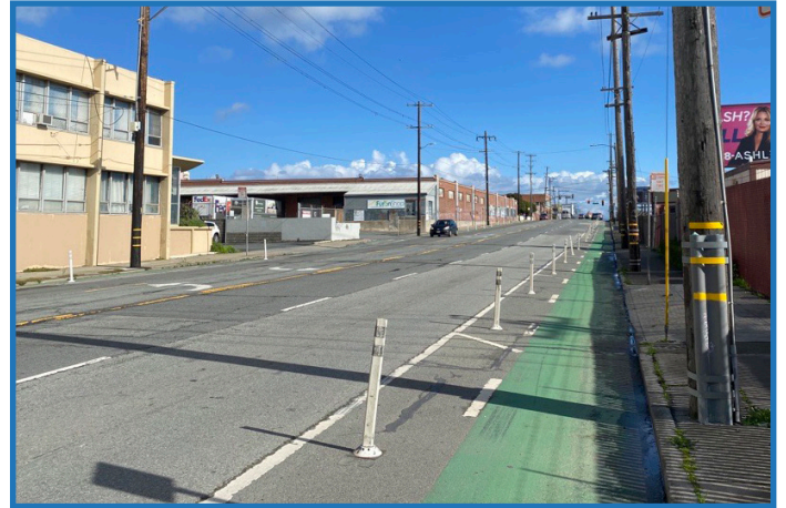
César Chávez St. cerca de Evans Ave. hoy

César Chávez forma parte de la Red de Alto Riesgo de Lesiones de la Visión Zero de la ciudad, donde el 13 por ciento de las calles de San Francisco concentran el 75 por ciento de los accidentes de tráfico graves y mortales.