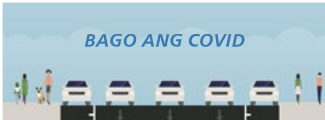
BAGO ANG COVID