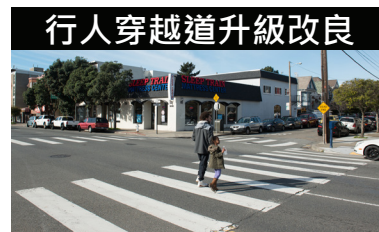
行人穿越道升級改良