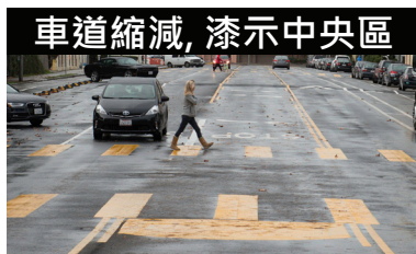
車道縮減, 漆示中央區

三藩市交通局提議進行速成工程（顯示於此），以解決Williams街的交通安全挑戰。讓我們知道您的看法！請透過下列電子郵件地址聯繫我們： BayviewQB@SFMTA.com